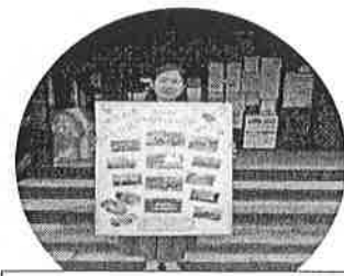
コールエニス混声合唱団