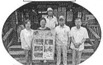
竹林ボランティア