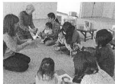
（手袋人形を作っているところ）