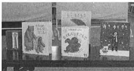
（テーブルの上には絵本がズラリ）