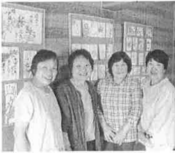
更生保護女性会のみなさん