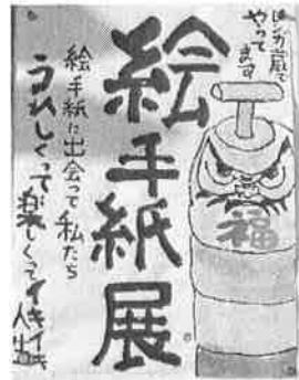
絵手紙展のポスター (だるま落とし)が懐かしい