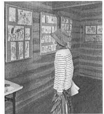
「素晴らしい作品ね!」・・・とおっしゃってました。