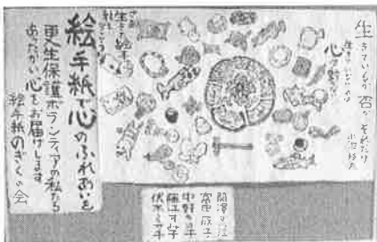
絵手紙で心のふれあいを!