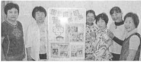
オピニオン連合 野木支部

自分たちの活動を多くの人に知ってもらい、興味を持ってもらえるか、パネル1枚で表現することに大いに悩みながら取り組みました。 新規に作製したパネルはきらり館に展示していますので、ぜひご覧ください。