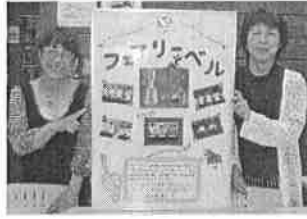
フェアリーベル (ハンドベル)