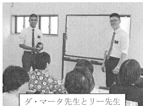
ダ・マータ先生とリー先生

来年オリンピックが日本で開催されることもあり、受講者の皆さんの学習意欲は大変高く、熱心に学習に取り組んでいます。