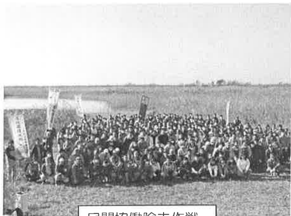
民間協働除去作戦

再生湿地の保全は行政や企業にも理解が広がり、第2調節池の環 境学習フィールド1～3では、小山市の事業に入れられ毎年5回の 保全活動が行なわれるようになりました。参加者は毎回500人～ 1,000人規模にまで広がり、外来植物セイタカアワダチソウやオオ ブタクサ、アレチウリ 等の除去を行ない、荒 地化を防いでいます。