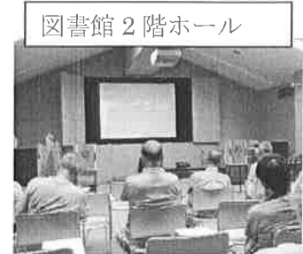
図書館 2 階ホール

この日は多くの参加者があり、スタッフの行き届いた会場作り、スムーズな司会進行、手際のよい音響機器の操作のもと、冷房の効いた快適な空間で、音楽を聴きながら心地よい楽しいひと時を過ごすことができました。(取材担当 谷津)