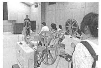
2台の16ミリ映写機で上映

デジタルでは、粒状性の良さ、やわらかさは、どうしてもまねできません。とても温かみがあります。16ミリ映写機の回っている「音」「におい」になぜかひかれます。16ミリフィルムを付け替えている時は、次は何が見られるのかワクワクしてきます。この日、なによりも、大きなスクリーンで映像を鑑賞し、心ゆくまで楽しむことができました。ありがとうございました。（取材担当 谷津）