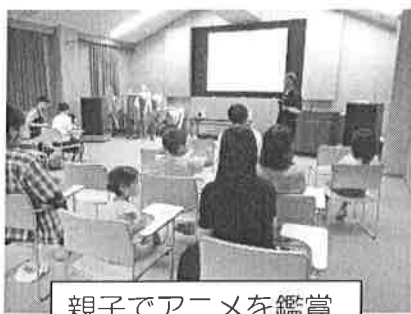
親子でアニメを鑑賞

この日は、参加者全員に手作りの「ぶんぶんごま」のプレゼントがありました。さっそく、こまを回して遊ぶ親子連れの姿が見られました。映画「おじいちゃん元気になって