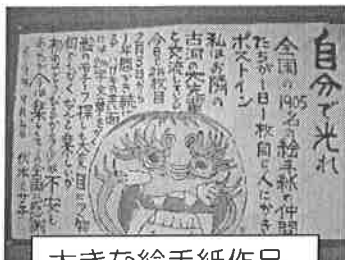
大きな絵手紙作品