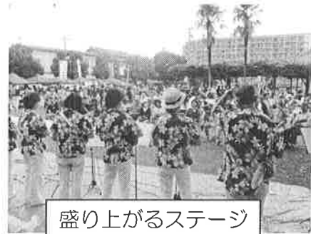
盛り上がるステージ

模擬店は、14店出店しました。一番の人気は、なんといっても実行委員会が行う、生ビールの販売です。行列ができるほど賑わっていました。焼き鳥、から揚げ、焼き餃子、焼肉、たこ焼き、ポップコーン・・・と、どの店も工夫して美味しいものを皆さんに提供していました。