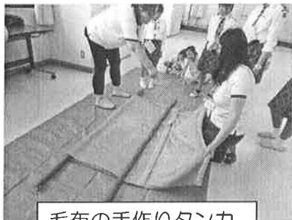
毛布の手作りタンカ