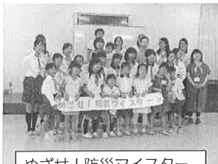
めざせ！防災マイスター