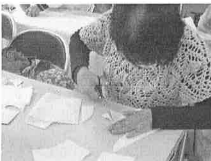
型紙に合わせて布を裁断

学校等に配付するため、4月中旬、きらり館登録団体「更生保護女性会」「ほっと♥ステーション」の皆さんによるマスクづくりが行われました。作成場所は、団体の個人宅を利用するなど、3密を作らないよう配慮して行いました。顔にフィットする立体型のマスクが出来上がりました。