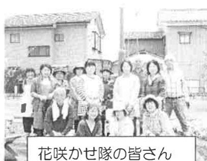
花咲かせ隊の皆さん

4月、きらり館の花壇には、色とりどりの花が咲き誇っています。パンジー、チューリップ、タイム類・・・。