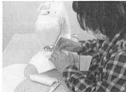
裁断された布をミシンで縫製